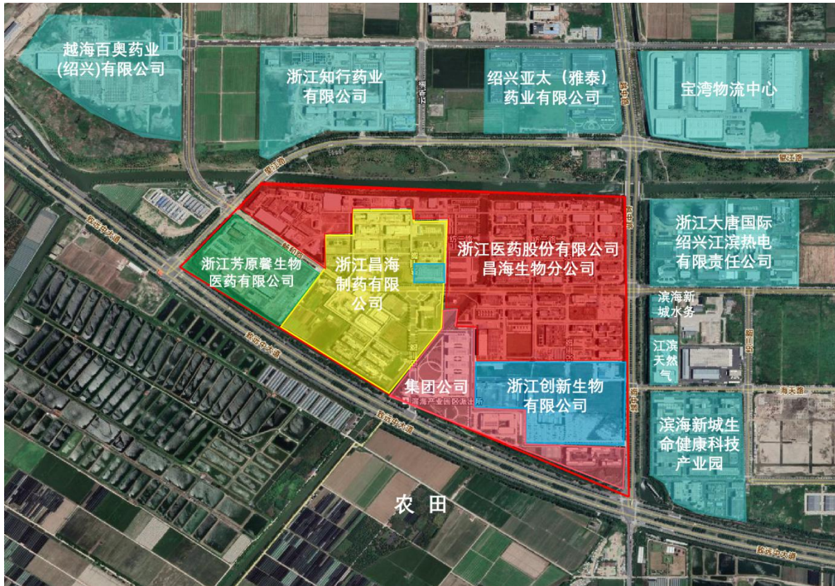
图 3.1-2 项目四邻关系示意图