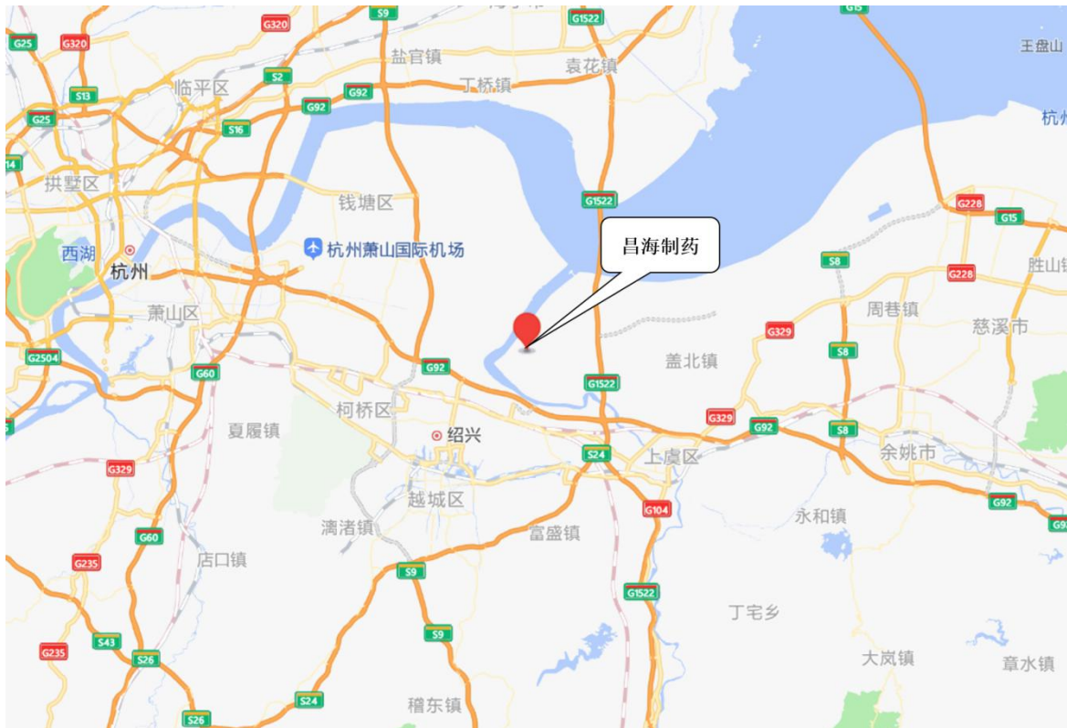
图 3.1-1 项目地理位置图

浙江昌海制药有限公司位于昌海生物产业园内，厂区呈不规则形状，占地面积 317.3 亩。与昌海生物公司、芳原馨生物公司相邻。昌海制药公司地理位置见图 3.1-1，项目周边环境关系见图 3.1-2。