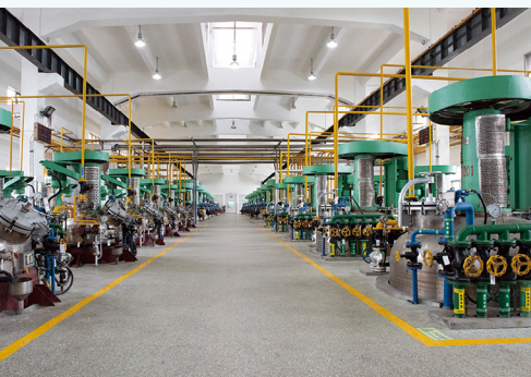
盐酸万古霉素生产设施。