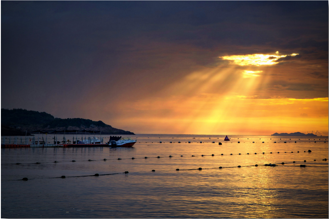
员工艺萃 摄影作品《云隙金辉》