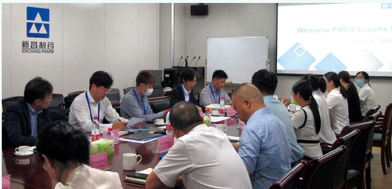
日本审计首次会议。