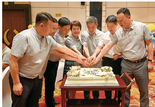
庆祝维艾乐成立十周年

会议期间，来自全国八大区域、四大职能部门及新零售团队的负责人依次汇报了上半年的工作成果及下半年的重点工作规划。上半年，维艾乐圆满完成了销售目标，但透过可喜的成绩单，我们也深刻洞察到后疫情时代大健康品类市场环境的危机，以及下半年各项工作的挑战。