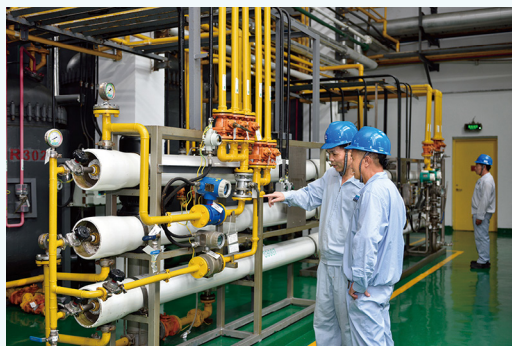
盐酸万古霉素生产设施。