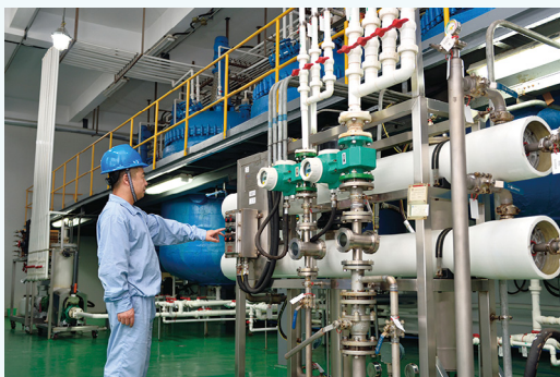
盐酸万古霉素生产设施。