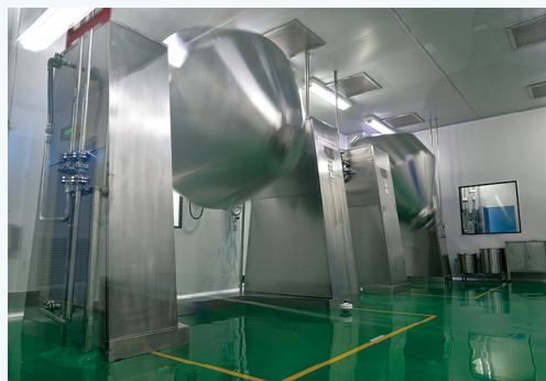
盐酸万古霉素生产设施。