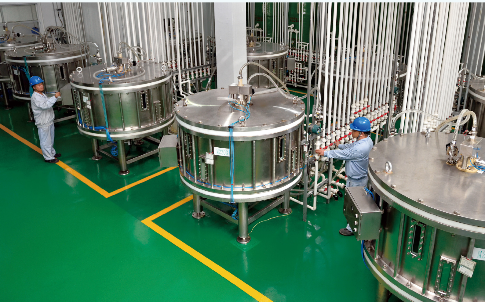
盐酸万古霉素生产设施。

药厂对迎检工作高度重视，周密部署和准备，反复自查和整改，在相关人员的密切配合和共同努力下，先后接受了韩国官方的远程视频审计和日本官方的现场审计。新昌制药厂于2023年8月21日收到了韩国的“医药品境外生产厂现场审计（远程审计）结果”，8月24日收到了日本的“GMP调查结果信”，韩国、日本官方审计分别以“零缺陷”和“五条微小缺陷”的良好结果顺利通过。