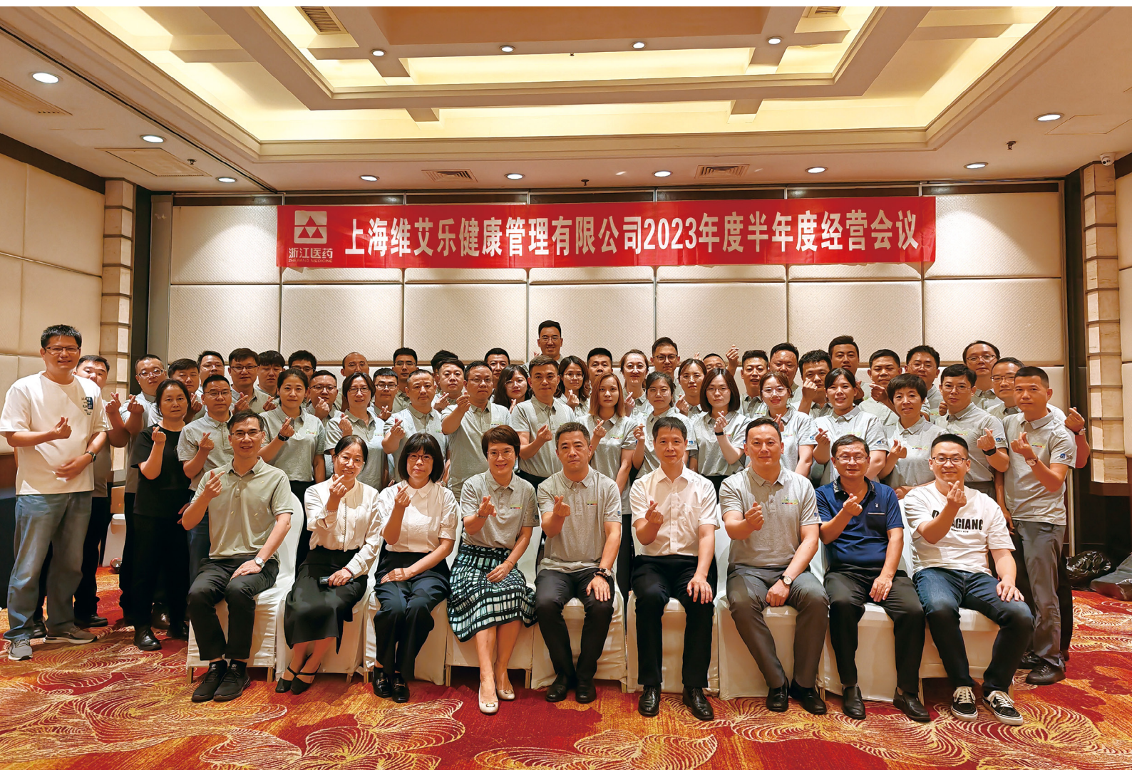
创新生物相关领导与维艾乐与会人员合影

2023年7月11日，上海维艾乐健康管理有限公司2023年度半年度经营会议在浙江绍兴圆满落幕。绍兴是浙江医药总部所在地，作为浙江医药旗下子公司创新生物的子公司，维艾乐的干部员工寻根探脉，在维艾乐十周岁之际，重温10年来创业的艰辛和不易，更加坚定奋勇拼搏再创新高的决心。