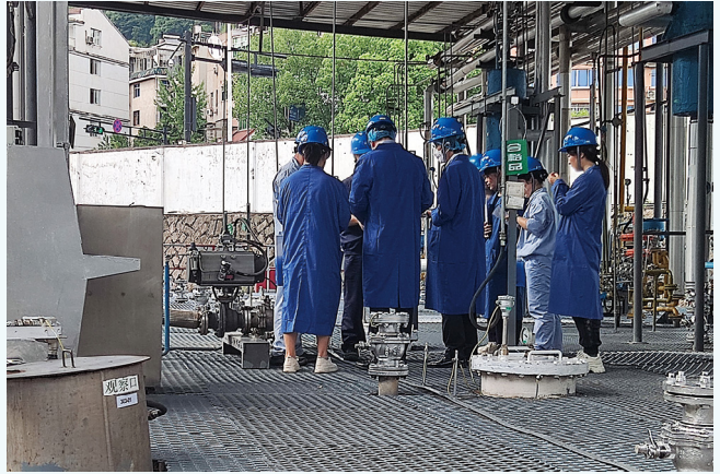
日本现场审计。