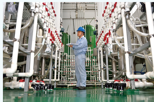
盐酸万古霉素生产设施。