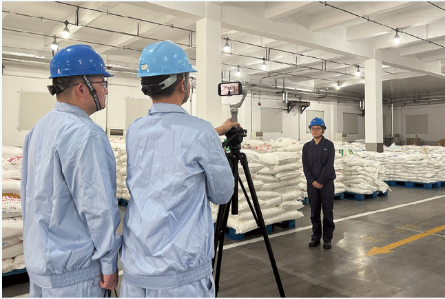
韩国视频审计。