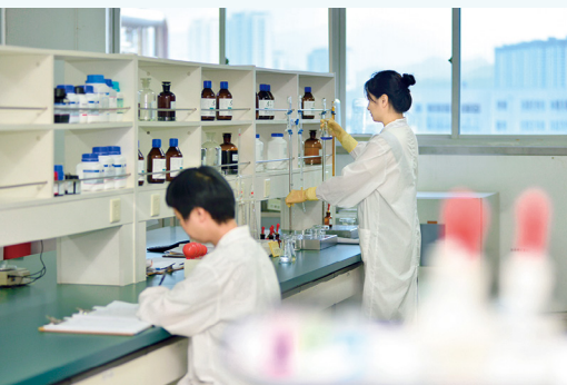
中控化验室。