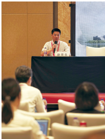
赵荣生教授主持卫星会